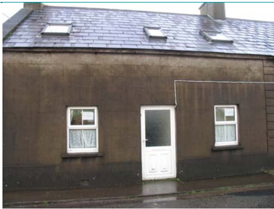
UIMH CHLÁR. Uimhir ar Léarscáil: 34

Ainm: 1 Tigíní an Imligh Seoladh: Tigíní an Imligh Baile: An Daingean Baile Fearainn: Imleach an Daingin Contae: Ciarraí