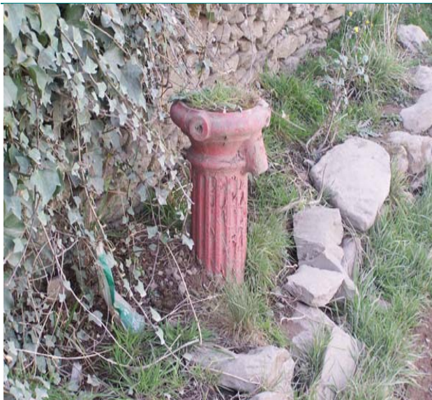
UIMH CHLÁR. Uimhir ar Léarscáil: 32

Ainm: Caidéal Uisce Seoladh: An Fearann Baile: An Daingean Baile Fearainn: An Fearann Contae: Ciarraí