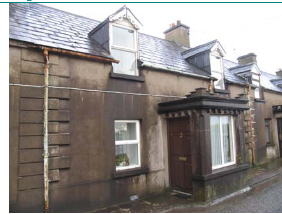
UIMH CHLÁR. Uimhir ar Léarscáil: 35

MEASTÓIREACHT: Ceann de shraith tigíní a tógadh go luath sa 19ú haois mar stáisiún garda cósta. Is é a dtábhacht gur tháinig siad slán mar ghrúpa. Ní rabhthas in ann dul isteach iontu, ach tá an chuma orthu i gcoitinne go bhfuil siad athraithe cuid mhaith istigh, ach bheadh na sonraí tógála istigh simplí, pé scéal é.