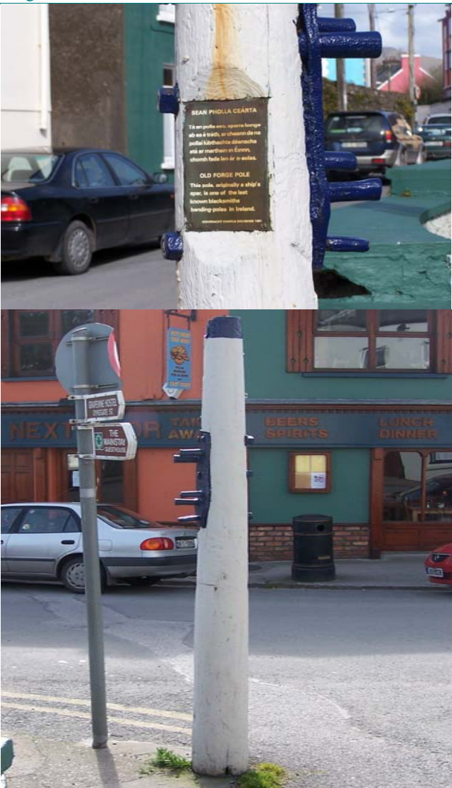
UIMH CHLÁR. Uimhir ar Léarscáil: 33

MEASTÓIREACHT: Ceann de chúig cinn de chaidéil uisce d'iarann teilgte a mhaireann fós ar an mbaile. Tábhachtach mar ghné de shaintréithe stairiúla sráide An Fhearainn.